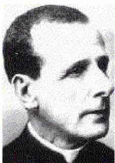
Pe. Landell de Moura

O Padre Roberto Landell de Moura - (1861-1928) - foi um homem de extraordinária aptidão para os estudos científicos. Sua mente brilhante percorria muitas áreas do conhecimento científico com muita facilidade. Certamente para ele, os vários nomes que tomam algumas atividades científicas como a Física , a Química a Medicina , a Parapsicologia , eram meramente uma questão de nomenclatura, pois ele transitava com muita facilidade por todas essas disciplinas. Os que já o conhecem lembram-se ao menos que seu nome está ligado às Telecomunicações, como inventor do aparelho rádio, capaz de comunicar a palavra humana através do espaço sem auxílio de fios.